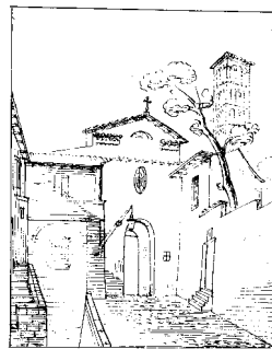
Eglise des SS. Michel et Magne à Rome. 1855